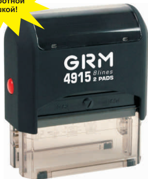
GRM 4915 2 Pads «Security штмп»

#&@#$%&f@#&#&@#&$%&@&$#@?&# @&$#@#&$@#&f@#&$@#&$&#@$ &@#&f$%f@#@&@f$@&@$#f #&$%f#&#f$%f@#&$%f@&#@f@ f&#&@&f@#&$%f#&$%f@&#$%f# @#f&@f$#&f$%f@#@&$%f#@#&$%f# &@#&f$%f@#@&@f$@&@$#f&#f #&@#&$%f@#&#&@#&$%f@&$#@?&#